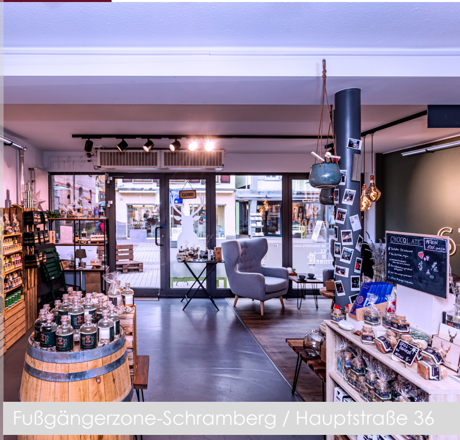
Fußgängerzone-Schramberg / Hauptstraße 36